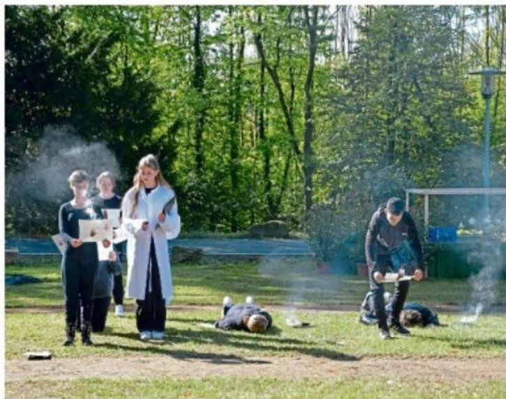
Die Theatergruppe zeigte, wie Patientinnen und Patienten quasi im Vorbeigehen zum Tode verurteilt worden waren.

Dass sich jemand um sie kümmert, sei das Einzige gewesen, das diese Menschen gewollt hätten, „mehr nicht“. Für jedes einzelne dieser Op-