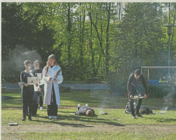
Die Theatergruppe zeigte, wie Patientinnen und Patienten quasi im Vorbeigehen zum Tode verurteilt worden waren.

Dass sich jemand um sie kümmert, sei das Einzige gewesen, das diese Menschen gewollt hätten, „mehr nicht“. Für jedes einzelne dieser Op-