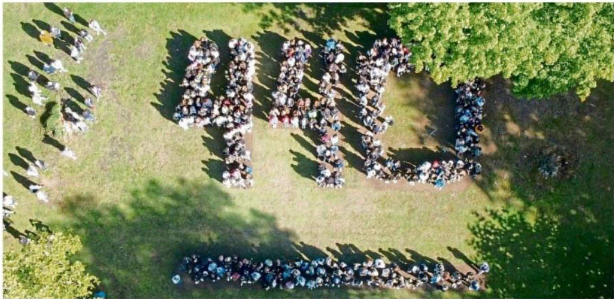
440 Jugendliche des Hannah-Arendt-Gymnasiums stehen stellvertretend für 440 deportierte und ermordete Patientinnen und Patienten.