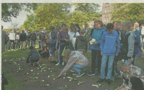
Weiße Rosen, viele davon mit den Karten mit dem roten Plus versehen, dem Todesurteil, legten die Jugendlichen auf dem Gedenkpfad der LWL-Klinik nieder.