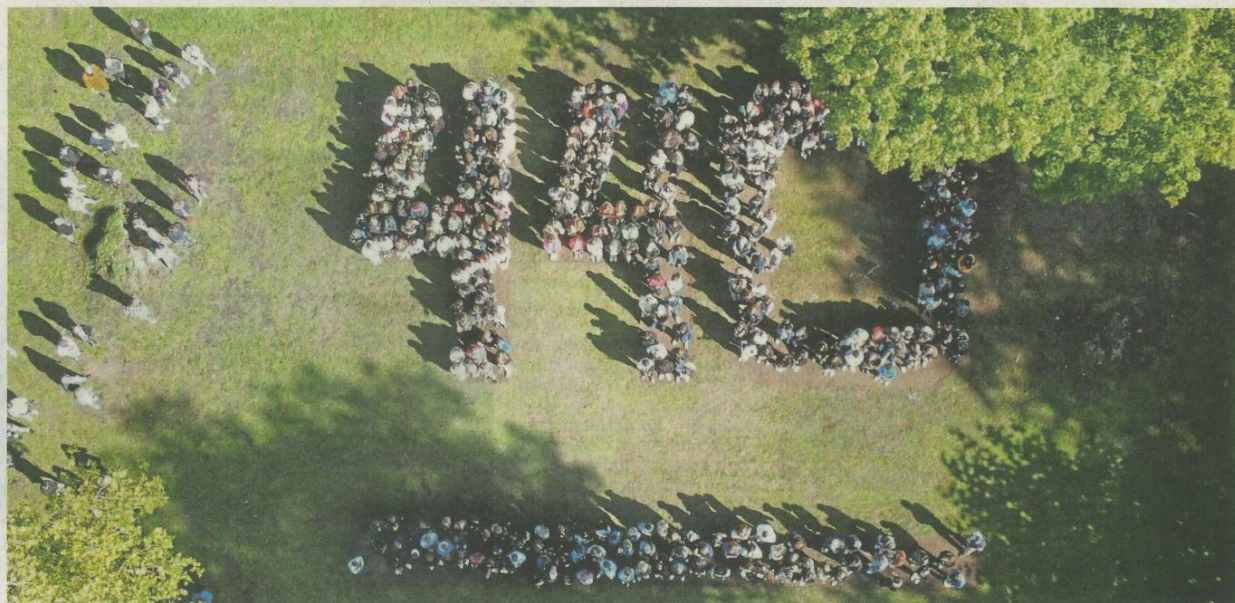
440 Jugendliche des Hannah-Arendt-Gymnasiums stehen stellvertretend für 440 deportierte und ermordete Patientinnen und Patienten.