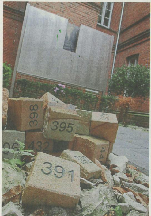
Alle auf der Tafel im Innenhof stehenden Namen werden am kommenden Dienstag vorgelesen.

■ Zum Gedenkpfad und zu den Krankentötungen in der NS-Zeit gibt es eine ausführliche Broschüre des Landschaftsverbandes. Er kann unter www.lwl-klinik-lengerich.de/flyerbroschueren/#gedenkpfad bestellt werden.