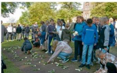
Weiße Rosen, viele davon mit den Karten mit dem roten Plus versehen, dem Todesurteil, legten die Jugendlichen auf dem Gedenkpfad der LWL-Klinik nieder.