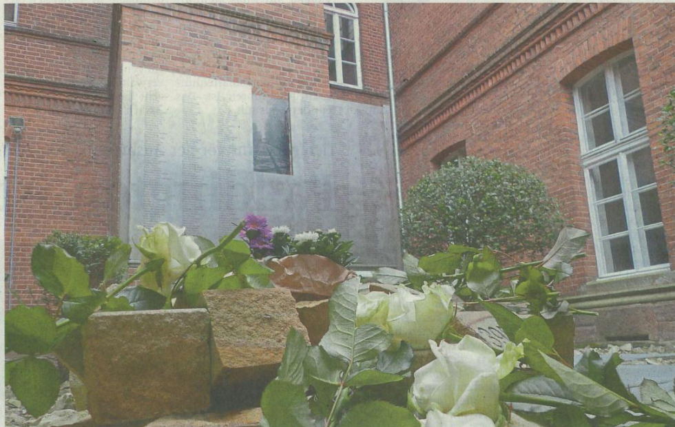
Vor der Namenstafel wurden Blumen niedergelegt, am Ende des Gedenkpfades eine Kletterrose gepflanzt (kleines Foto). Wenige Meter davon entfernt findet sich auch eine Tafel, auf der erläutert wird, warum es den Gedenkpfad gibt und was sich daraus für die Zukunft ergibt.