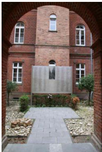
Die Gedenktafel im Innenhof der LWL-Klinik Lengerich.