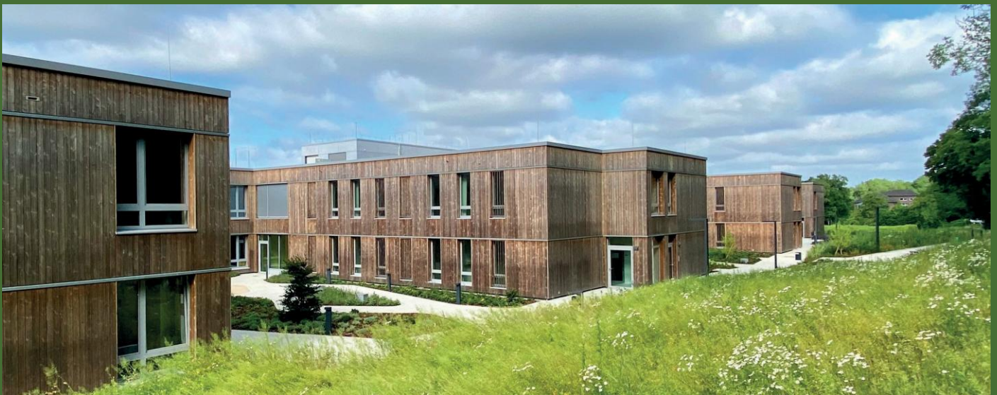
LWL-KLINIK LENGERICH - NEUBAU